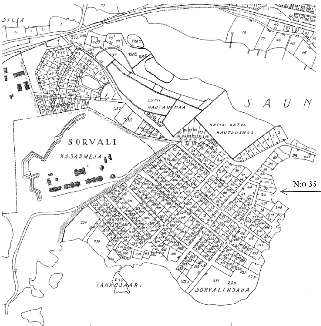
SORVALIN KARTTA VUODELTA 1929. KARTTAAN ON MERKITY NUMEROIN KAIKKI SORVALIN TONTIT. ISÄN LAPSUUDENKOTI RANTAKATU KOLMESSA ON TONTILLA N:O 35. VIEREISEN SIMELLIN TALON TONTIN N:O ON 34. RANTAKATU OLI MYÖHEMMIN NIMELTÄÄN VEISTÄMÖNTIE. – KUVA ON ILMESTYNYT JUHANI LANKISEN TEOKSESSA KAUPAN JA TEOLLISUUDEN VIIPURI. PAMAUS 110-VUOTIAS. KARJALAN KIRJAPAINO OY LAPPEENRANTA 2000.