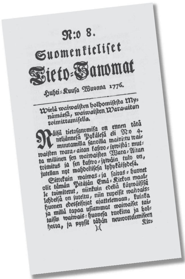
Maan ensimmäisen suomenkielisen sanomalehden aikaan- sai 1775 Anders eli Antti Lizelius, nyky-Sastamalassa synty- nyt Mynämäen kirkkoherra.

Yhdellä tilatulla sanomalehdellä lienee ainakin Finlaysonin patriarkalisessa tehdasvaltakunnassa ollut kyllä useampiakin lukijoita.